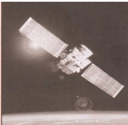
1- Solaire spatiale