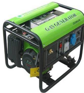
2- Groupe électrogène