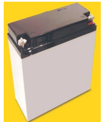
4- * Batteries ou * Pile à combustible...