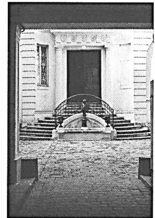
Entrée sur cour, 22 rue Dussoubs, Paris.