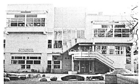
Entrée de l'école Montessori, Amsterdam, Hermann Hertzberger arch., 1980-1983.