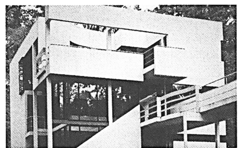
Entrée de la maison Hanselmann, Indiana, Michael Greaves arch., 1967.

La façon d'entrer et de franchir la porte perpétue des rituels culturels. Une manière d'ennoblir le passage existe jusque dans les habitations les plus modestes et rudimentaires où les valeurs du monde intérieur sont annoncées par un ouvrage particulier. Marches, perrons , marquises , avant-toits , porches , portails , ... chacun de ces éléments offre un espace de transition et de représentation au seuil de la maison.