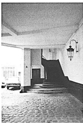
Entrée sous porche, 77 rue Amélot, Paris