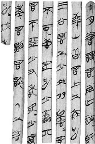
الكتابة الصينية القديمة على شرائح سيقان نبات البامبو

كاتبه سون تزو (أو السيد/الحكيم/القائد سون) هو القائد الأعلى لجيش مملكة وو، وهو وضع كتابه هذا بناء على طلب من الملك، وخصه لصفوة القادة العسكريين في زمنه، على أن نصائحه ومبادئه استوعبها الجميع وحتى يومنا هذا، بداية من محاربي الساموراي اليابانيين الأشداء، ومروراً برائد نهضة الصين ماو زدونغ، وانتهاء برجال الأعمال المتمرسين في وقتنا الحاضر.