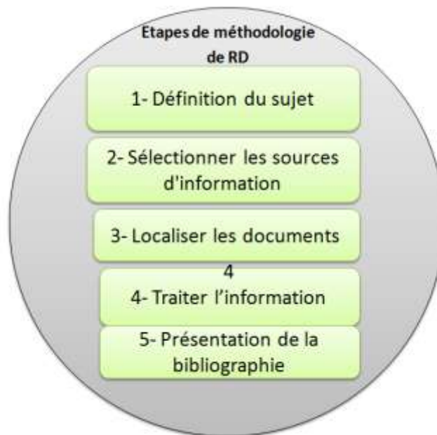
Figure I.1 étapes de la recherche documentaire.

Elle va s'articuler autour de 5 étapes successives :