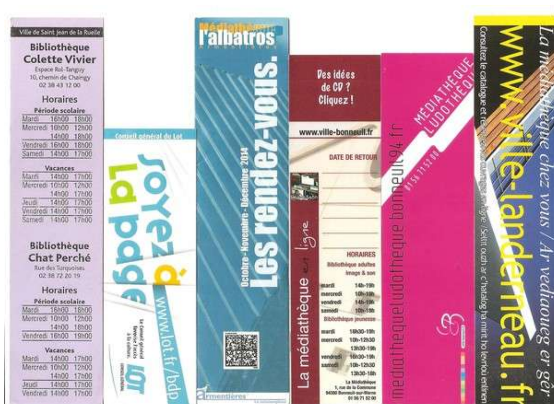
Figure II.1 photo d'une page d'un catalogue de bibliothèque.

Un catalogue de bibliothèque est destiné à faciliter la recherche des livres qui sont contenus dans une bibliothèque : livres, revues, thèses, vidéocassettes, documents électroniques, lois, publications officielles, documents cartographiques, etc. De nos jours, il permet également l'accès à des ressources électroniques sélectionnées. Le repérage de ces documents se fait par auteur, titre, sujet, mots-clés, etc.