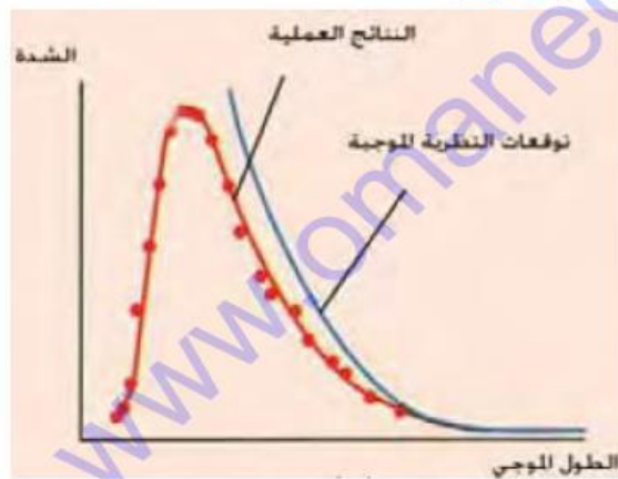
مقارنة بين النتائج العملية و توقعات النظرية الموجية لمنحنى الإشعاع للجسم الأسود.

ولكن عندما توفرت الأجهزة المستخدمة لقياس شدة الاشعاع، تبين عمليا أن شدة الإشعاع المنبعث تقترب من الصفر كلما اقترب الطول الموجي من الصفر (الجزء الأيسر من منحني الإشعاع للجسم الأسود) ولم تستطع النظرية الموجية للضوء تفسير هذا الانخفاض.