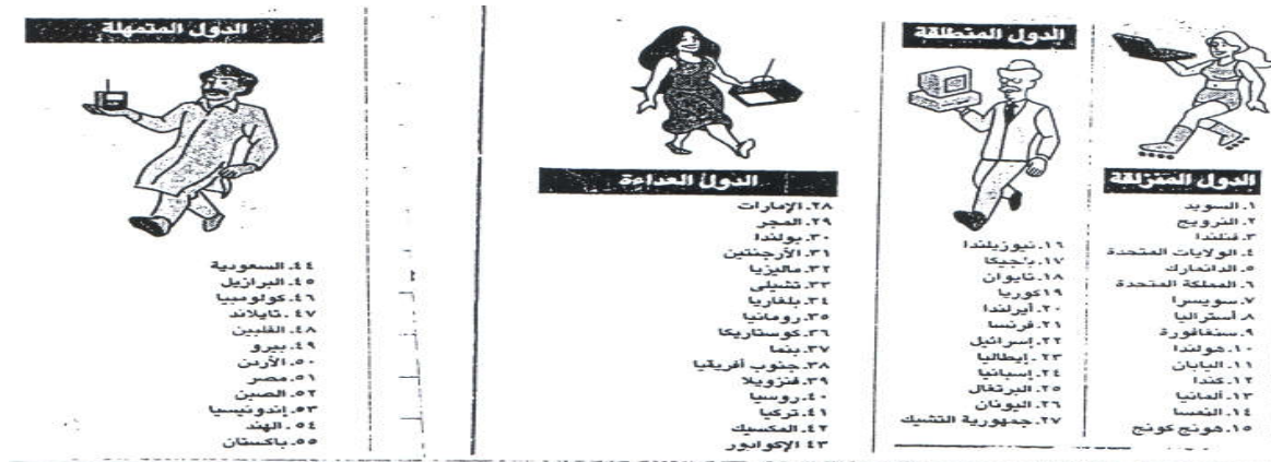
الشكل رقم 04: نتائج مؤشر النفاذ لتكنولوجيا المعلومات والاتصالات في 55 دولة 41

مؤشر تنمية تكنولوجيا المعلومات والاتصالات: ICT Development Index (IDI) الذي ينشره الاتحاد الدولي للاتصالات التابع للأمم المتحدة، ووفقا لهذا التقرير، فإنه يتم قياس مجتمع المعلومات وفقا للمؤشرات المتاحة على موقع: