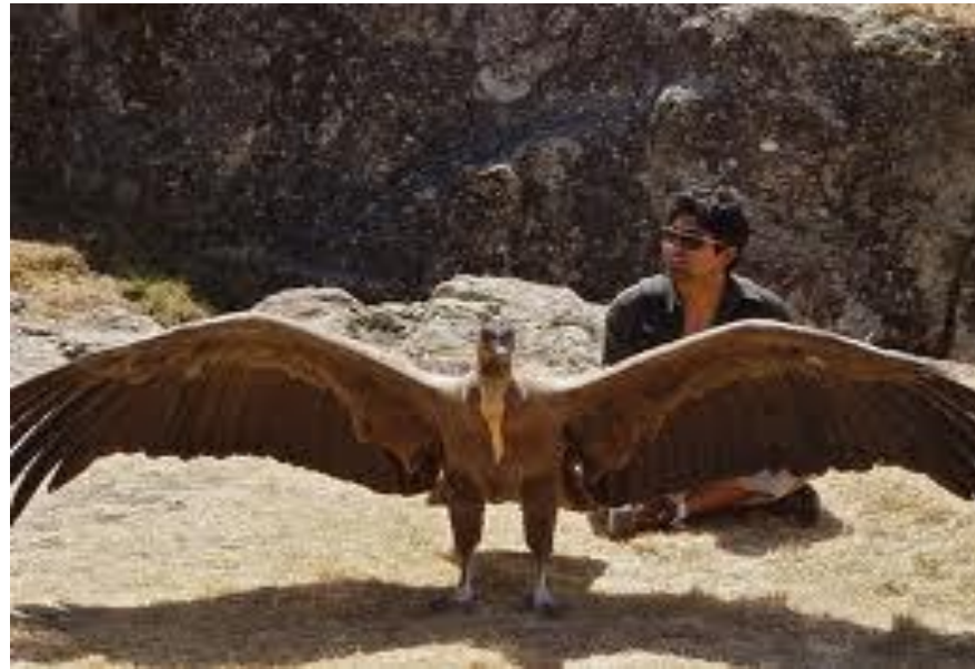
espèce : Vultur gryphus (Condor)