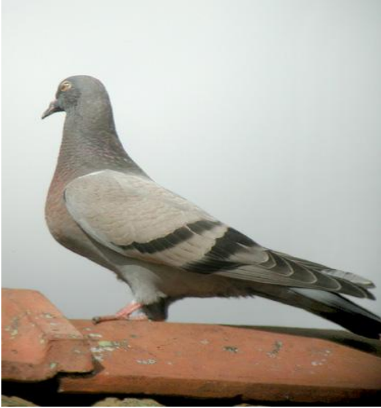
Espèce: Columba livia (Pigeon)