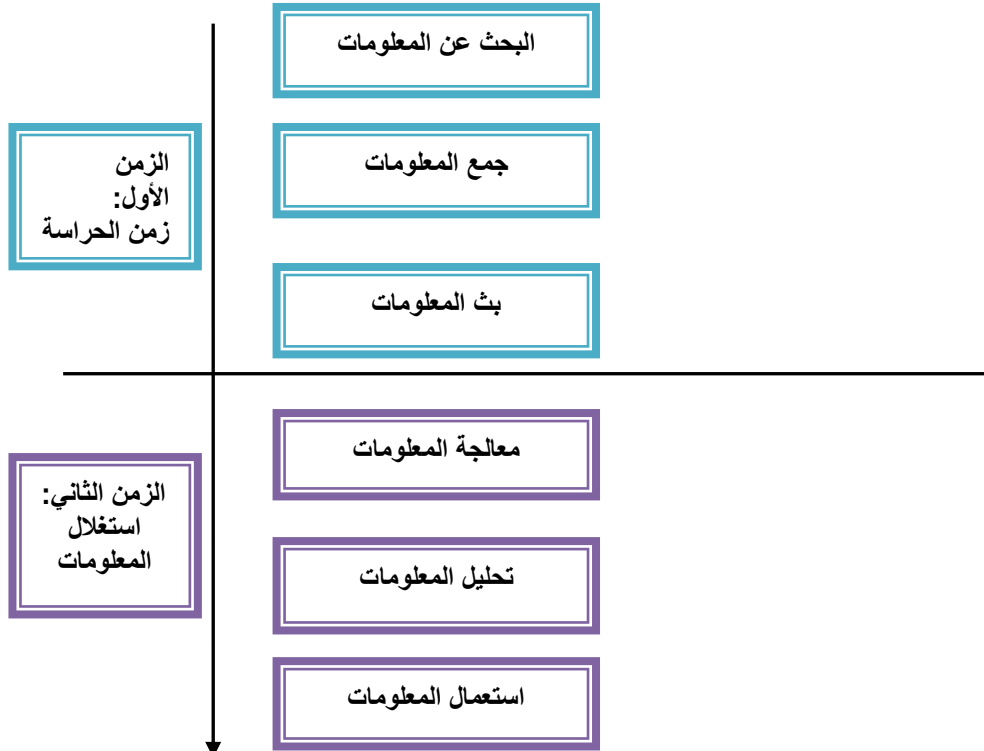
شكل يوضح: نموذج الزمنيين لليقظة الإستراتيجية لـ Gerarld VERNA

3-2/ عملية استعمال المعلومات: حتى تكون القرارات المتخذة في المؤسسة أكثر رشادة و عقلانية، يجب أن يكون هناك التوظيف العلمي و العملي للمعلومات التي تم تثبيتها، في عملية اتخاذ القرار، و الغاية الرئيسية من وراء ذلك هو تحسين السلوك الاستراتيجي للمؤسسة.