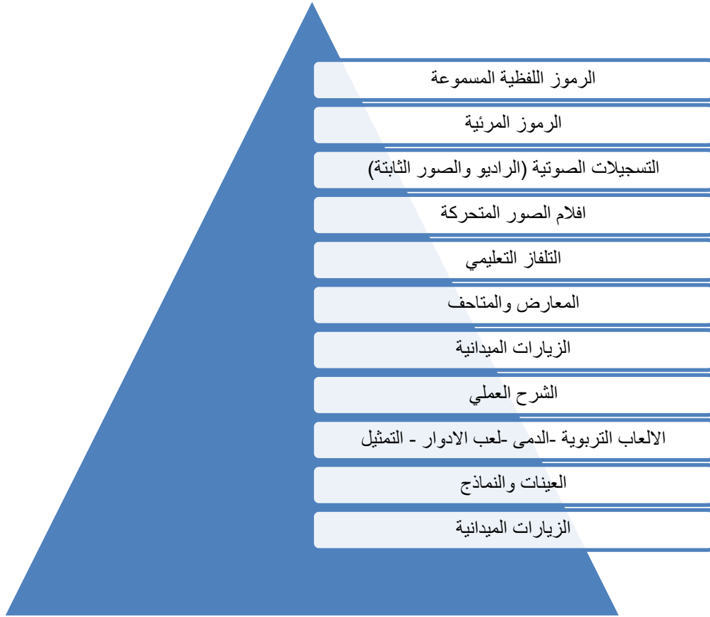
شكل رقم 2 يوضح مخروط الخبرة ل ادجار ديل