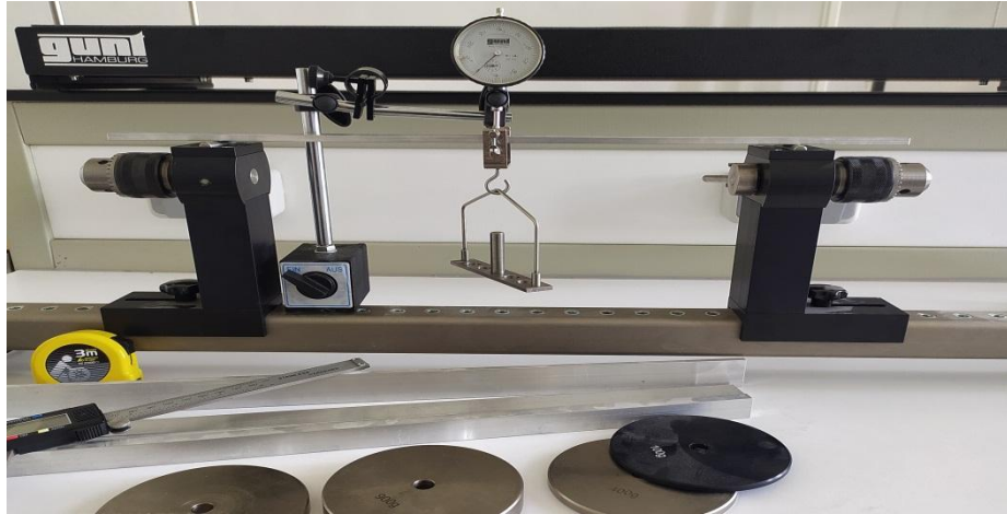
Figure 2. Appareil d'étude de flexion des poutres.