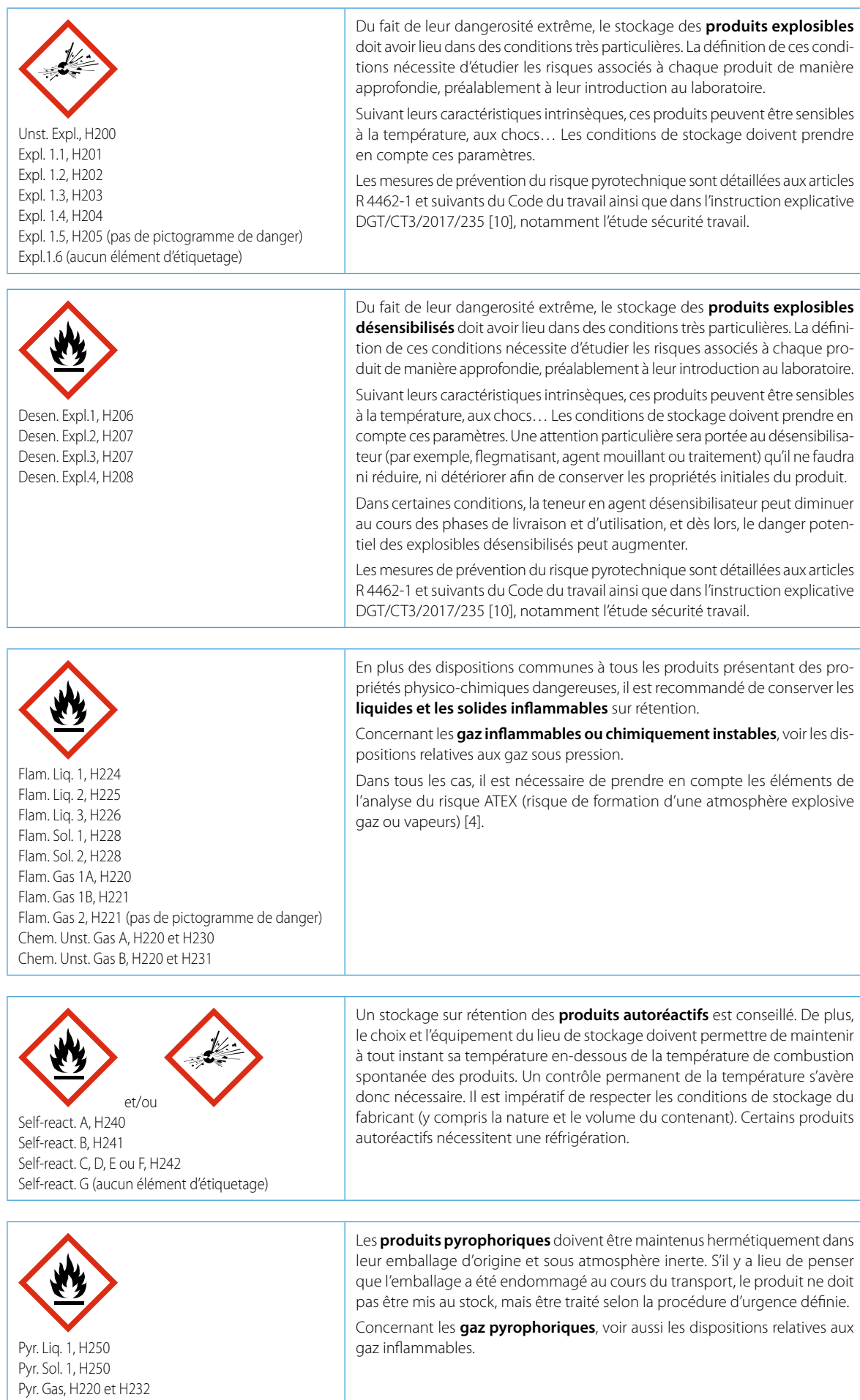
Tableau A. Préconisations complémentaires pour la séparation des produits présentant des propriétés physico-chimiques dangereuses