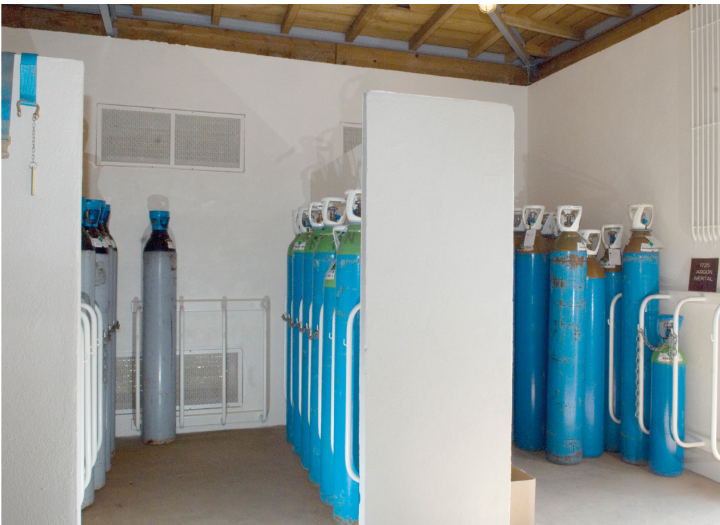
Stockage de bouteilles de gaz.